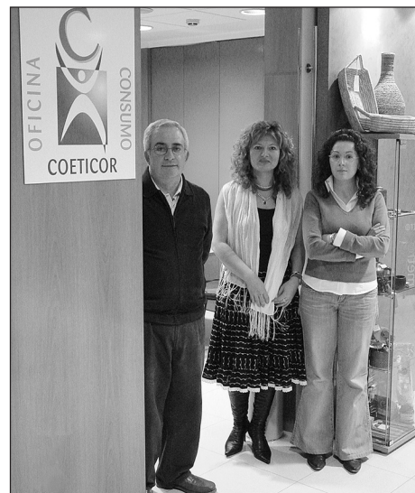
Parte do equipo humano que integra ConsumoCoeticor

de suficientes recursos humanos e co Instituto Galego de Consumo como colaborador, ConsumoCoeticor ten como misión informar e defender os dereitos dos consumidores, así como mediar en conflitos e promover o arbitraje. É, en definitiva, un instrumento máis en prol daquelas actividades respetuosas coa calidade, o medio ambiente, o desenvolvemento sostible e a mellora tecnolóxica, tres alicerces básicos do Coléxio coruñés desde o seu fundación.