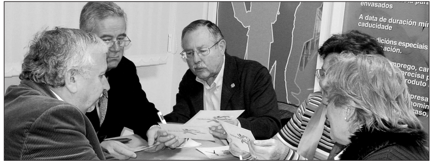
Os consumidores teñen dereito a participar na elaboración de disposicións xerais que lles afecten

A Lei de Garantías de 2003 esixe que os bens (nin inmuebles nin servizos) de consumo sexan conformes ao ofrecido na venda, a publicidade ou o etiquetado do produto. De non selo, o consumidor pode esixirlle responsabilidades ao vendedor nun prazo de dous anos desde a compra ou entrega; o que se denomina "garantía".