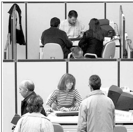
Mediación e arbitraje son canles voluntarias e gratuítas

establecemento seguindo o procedemento que teña establecido para atender consultas e reclamacións. Se non se obtén resposta ou esta non satisfai ao consumidor, a alternativa é acudir á Administración. En Galicia, o Instituto Galego de Consumo do Goberno autónomo conta cun servizo gratuito de información telefónica, o 900 231 123, e un e-mail, igc@xunta.es . Existen ademais outros organismos adscritos á Administración como as Oficinas Municipais de Información ao Consumidor (OMICs), as Asociacións de Consumidores e a nova Oficina de ConsumoCoeticor.