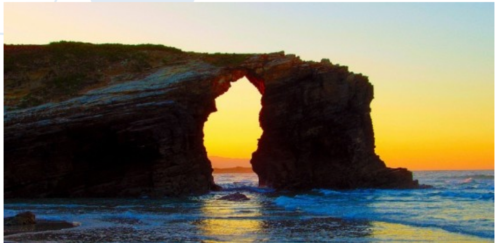
Galicia: Playa de Las Catedrales, puesta de sol