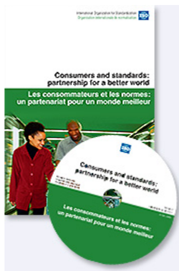
Guía didáctica on-line

Los consumidores de todo el mundo quieren productos y servicios seguros, de calidad y respetuosos con el medio ambiente y esto se consigue gracias a las tareas de normalización, actividad en la que ISO quiere una mayor implicación de los ciudadanos.